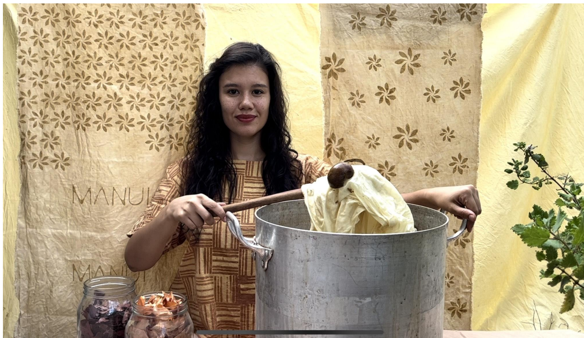
Manui Brasil propõe semear uma moda brasileira com tingimento natural vegetal

COR , empresa focada em disseminar a moda Hemp Revolution, irá desfilr sua moda Private Label. Além dessas também estarão a Amar, Rara, Baked Brain, Cannabiba, Nalimo e Mona .