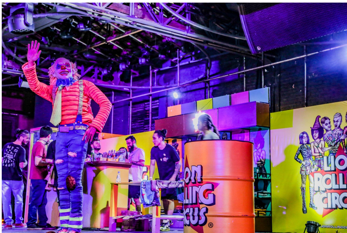
Festival Híbrido de 2022

O Festival Híbrido também terá como apoio uma plataforma multidisciplinar, promovendo o contato entre empresários, consumidores e lojistas.